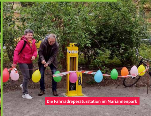
Die Fahrradreparaturstation im Mariannenpark