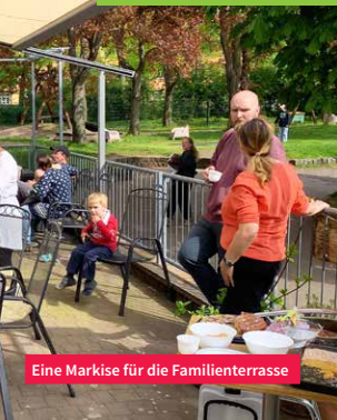
Eine Markise für die Familienterrasse

Danke. Diese Maßnahmen wurden mitfinanziert mit Steuermitteln auf Grundlage des Aktionsprogramms Aufholen nach Corona für Kinder und Jugendliche und/oder aus Mitteln vom Amt für Jugend und Familie und Mitteln des Stadtbezirksbudgets Nord-Ost.