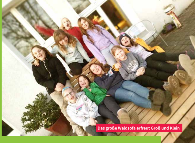
Das große Waldsofa erfreut Groß und Klein

Danke. Diese Maßnahmen wurden mitfinanziert mit Steuermitteln auf Grundlage des Aktionsprogramms Aufholen nach Corona für Kinder und Jugendliche und/oder aus Mitteln vom Amt für Jugend und Familie und Mitteln des Stadtbezirksbudgets Nord-Ost.