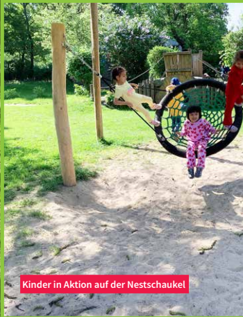
Kinder in Aktion auf der Nestschaukel