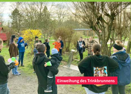
Einweihung des Trinkbrunnens