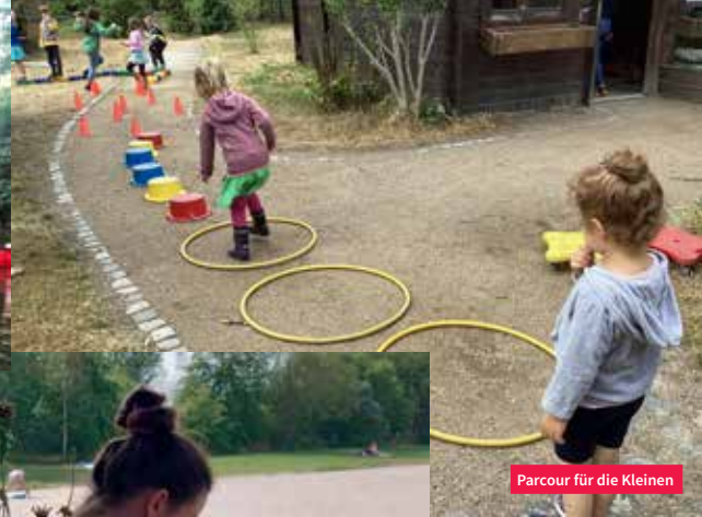
Parcour für die Kleinen