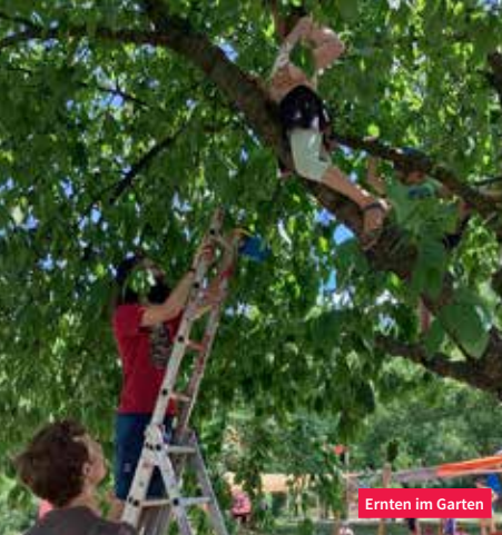
Ernten im Garten