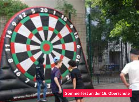
Sommerfest an der 16. Oberschule