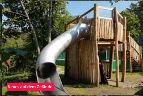
Neues auf dem Gelände